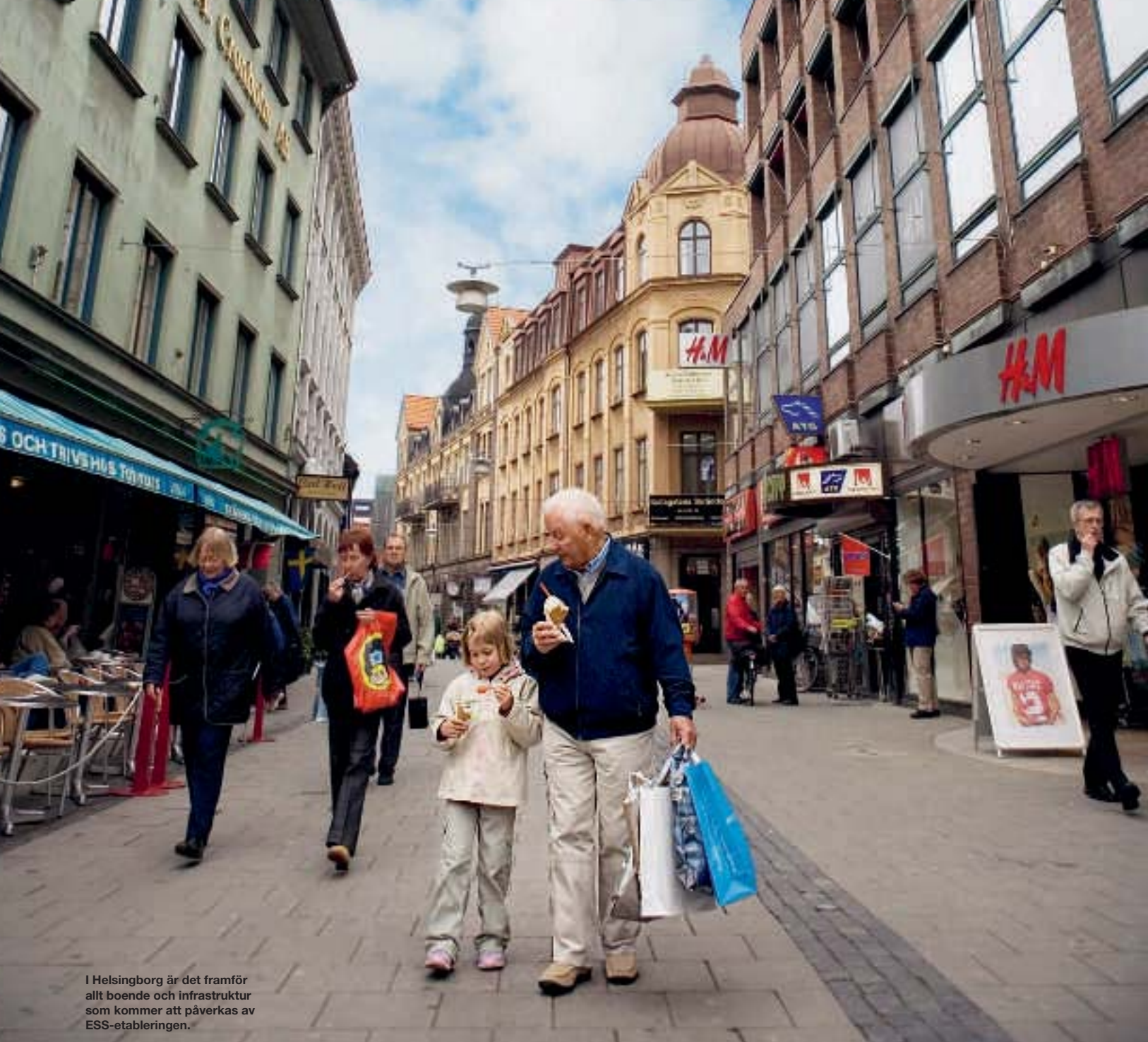
I Helsingborg är det framför allt boende och infrastruktur som kommer att påverkas av ESS-etableringen.