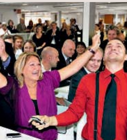
Jubel i Umeå när det stod klart att staden blir kulturhuvudstad 2014.