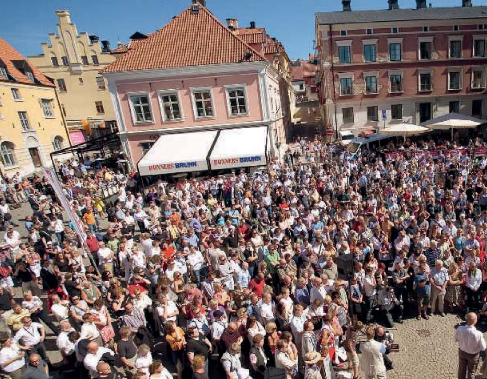
Nytt för 2009 var att framtidsdialogerna avrundades under politikerveckan i Almedalen.