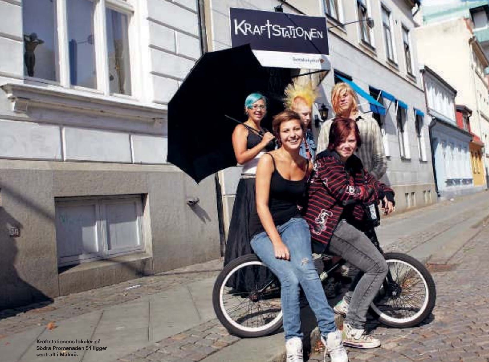
Kraftstationens lokaler på Södra Promenaden 51 ligger centralt i Malmö.

mattan. Det finns också ett skapartorg där man kan göra pins eller pimpa sina kläder.